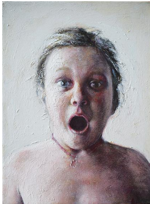
Φόβος, 36x27εκ, Μεικτή τεχνική σε καμβά Fear, 36x27cm, mixed media on canvas