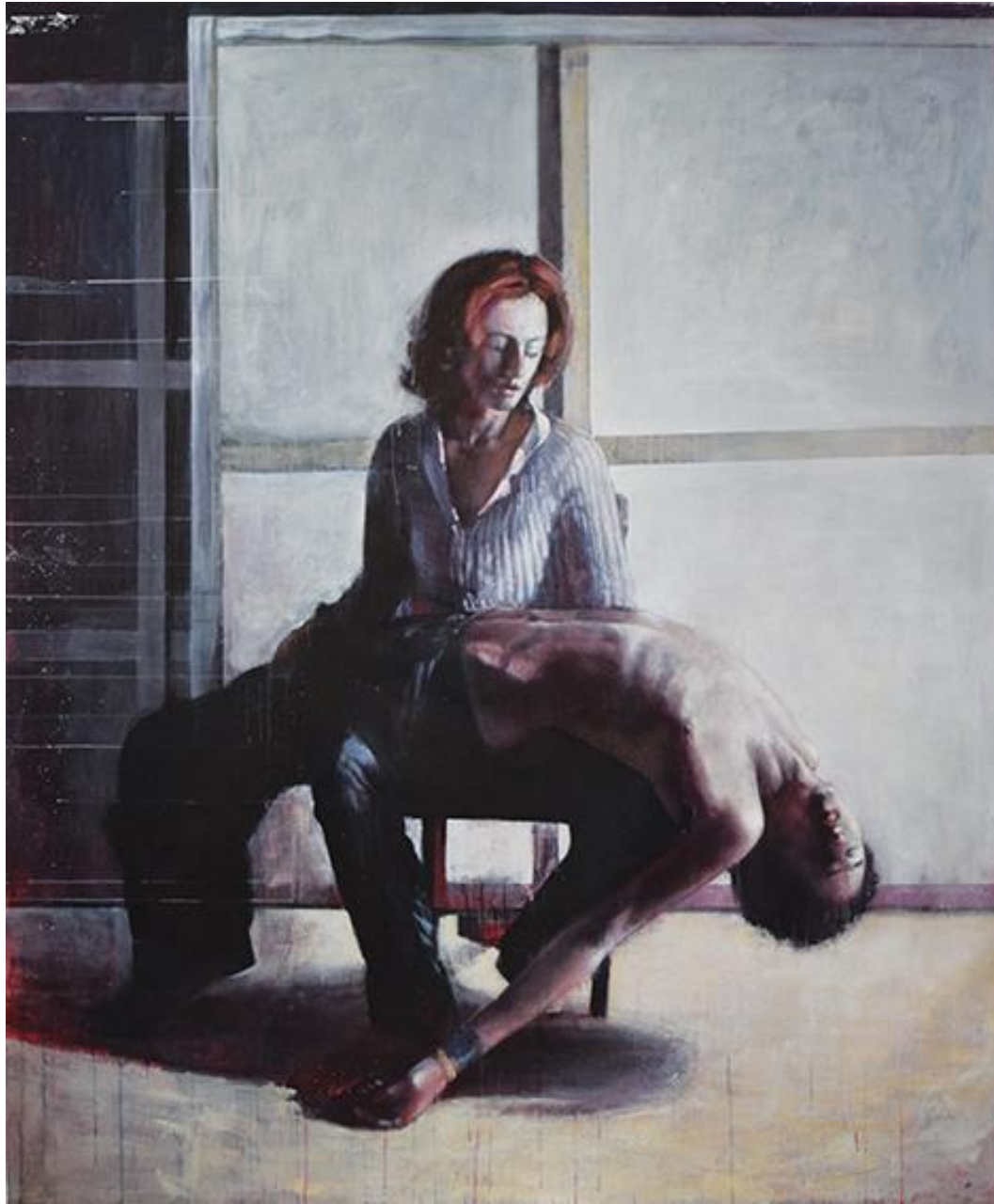
Πιετά - Μήδεια, 180x150εκ, Λάδι σε καμβά / Pieta - Medea, 180x150cm, oil on canvas