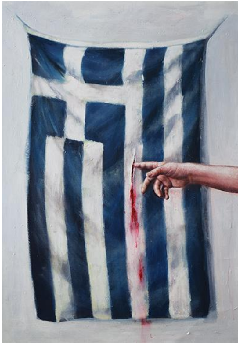
Επί τον τύπον των ήλων, 100x80εκ, Μεικτή τεχνική σε καμβά Into the print of the nails, 100x80cm, mixed media on canvas