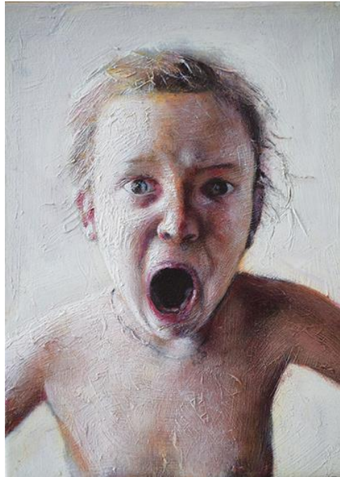
Κραυγή, 36x27εκ, Μεικτή τεχνική σε καμβά Scream, 36x27cm, mixed media on canvas