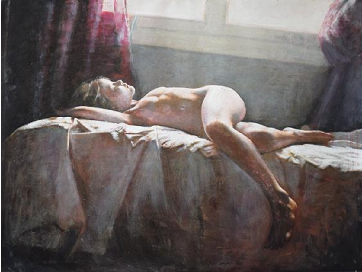
Στην αγκαλιά του Μορφέα Ι, 100x 35εκ, Μεικτή τεχνική σε καμβά In the Embrace of Morpheus I, 100x135cm, mixed media on canvas