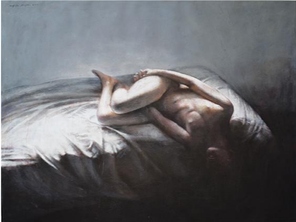
Στην αγκαλιά του Μορφέα II, 100x135εκ, Μεικτή τεχνική σε καμβά In the Embrace of Morpheus II, 100x135cm, mixed media on canvas